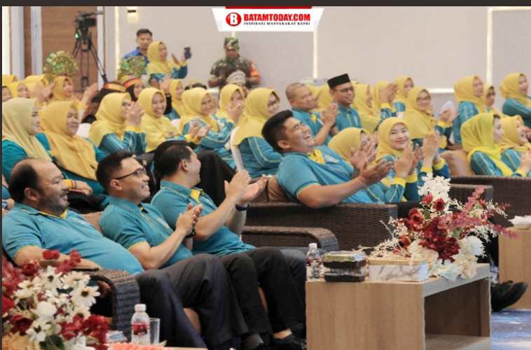
Suasana kemeriahan saat acara Jambore PKK Bintan Tahun 2023