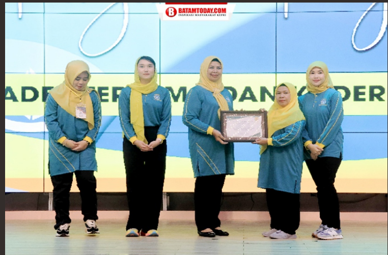
Ketua PKK Kepri dan Bintang menyerahkan penghargaan kepada peserta Jambore