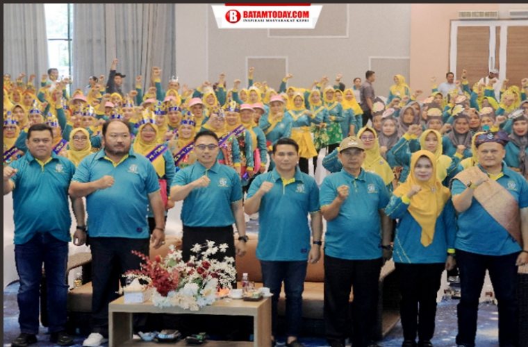
Foto bersama peserta Jambore PKK Kabupaten Bintang Tahun 2023

Abadikan moment spesial Anda di BATAM TODAY Gallery Photo untuk pemesanan hubungi: Telp: (0778) 7482-514 Email: batamtoday@gmail.com