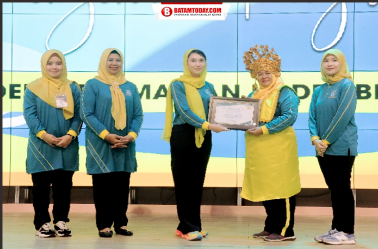
Penyerahan Penghargaan kepada peserta Jambore PKK Bintang Tahun 2023

Batam Today @Batamtoday @Batamtoday Batam Today